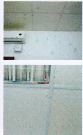
圖5、牆壁(上)、天花板(下)之噴濺血跡形態