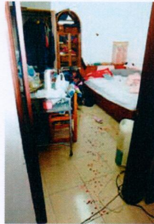
圖4、房間地面血跡情形

三、死者傷勢情形：死者身高約164公分，於頭頂處發現一星芒狀傷口(如圖6)，研判係槍擊造成，身體餘處未發現有明顯傷勢或射出口，左手掌發現有細小血點(如圖7)，在背部第四胸柱尋獲彈頭一枚，另死者所著衣褲均發現有血跡(如圖8)，採取死者雙手及外套袖口之射擊殘跡鋁座送請刑事警察局鑑驗。