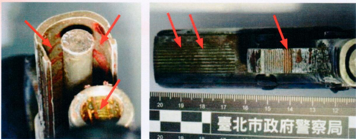
圖9、手槍前端之血跡分布情形

五、涉案槍彈：槍前端和槍管內部均發現有血跡(如圖9)，另將本案槍彈送請刑事警察局鑑驗，並採取彈殼內部之射擊殘跡作為比對標準品送驗。