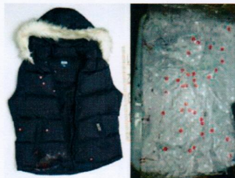
圖3、收納箱和黑色羽絨背心上之血點

二、陳屍房間：床頭旁床板發現有滴流血跡，緊鄰該處地板為一血灘，地面多處滴落型血點延伸至客廳地面之血灘，研判係急救過程所致(如圖4)。另於棉被和床單上發現有明顯血點，