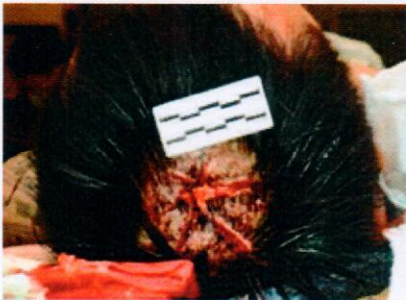
圖6、死者頭頂處之星芒狀傷口