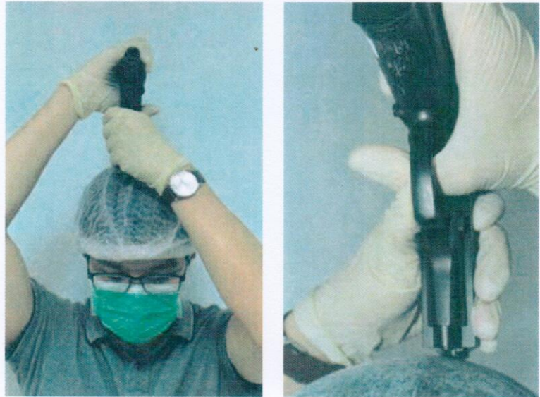
圖10：槍擊重建分析模擬情形

六、刑事警察局部分槍擊重建分析：他人以手握槍射擊，會對握把處造成遮蔽效應，無法形成涉案槍枝握把處之血跡型態。經實際模擬數種可能槍擊姿勢，發現死者自行以右手反持槍枝(握把朝身後)，右手大拇指扣動板機，左手輕扶滑套前端射擊，可產生與死者手部及涉案槍枝上噴濺血點型態相符之情形(如圖10)。