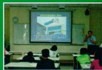
0920 物理鑑識-孟憲輝教授