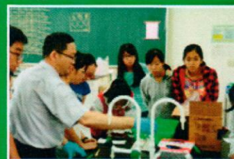
0919 化學鑑識-王勝盟教授

此外，並利用此機會宣導「犯罪現場保全」作法及遭竊盜時的因應方式，教導學生們如何配合警方做好現場保全工作，比事後投入更多的警力、物力還要重要。鑑識科科長呂政鴻表示：「李昌鈺博士說過：『現場是物證的寶庫，嫌犯行為的活紀錄』，做好現場保全，是破案最重要的關鍵。」