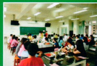
0919 生物鑑識-蔡麗琴教授

案實錄，例如去年發生的槍擊殺人命案，從現場血跡的噴濺型態，加上被害人身上中彈傷勢情形，利用血跡型態與彈道重建方式，還原出槍擊發生當時情況；或是同時期發生的重大竊盜案，鑑識人員如何抽絲剝繭，從竊嫌破壞玻璃所遺留的犯罪工具，及竊取車牌來躲避查緝的現場，鉅細靡遺的探證，一步一步的找出連結歹徒的證據，成為破案關鍵！