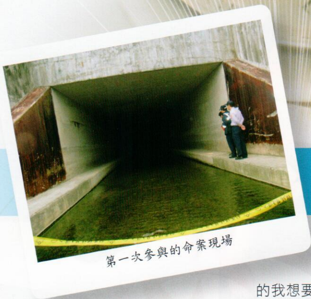
第一次參與的命案現場