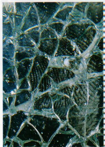
汽車內財物遭竊案 玻璃上的指紋跡證

較難在自己的職位上做長遠計劃的發揮。慶幸我的專業讓我可以追尋自己的目標，同時感慨到：如果還有那麼多想做的事，在分局裡憑藉現有的專業和位置，應該還能有更多的作為，一定要更用心去尋求改變現況，找出使未來更好的方向，而不是只當辦公文的機器，或完成上級交辦事項就感到滿足！FACT