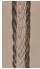
單鉤形與雙鉤形 (兔)