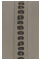
單排念珠形 (環尾狐猴)