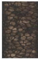
多排晶格形 (藏羚羊)